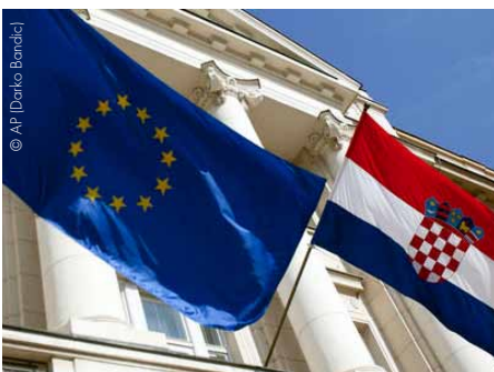
Kroatien und die EU - eine Kombination, die immer harmonischer wird.