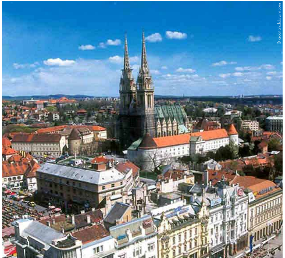
Kroatien ist bereit für den Eintritt in die Europäische Union.

Ein Drittel aller Auslandsinvestitionen Kroatien und Österreich sind wirtschaftlich eng miteinander verbunden. „Österreichische Unternehmen sind in allen Sektoren groß vertreten und genießen einen ausgezeichneten Ruf“, betont der WKÖ Präsident. Vor allem viele kleinere und mittlere Unternehmen wollen aber den EU-Beitritt des Landes abwarten, bevor sie mit größeren Investitionen aktiv werden. Auf die ös-