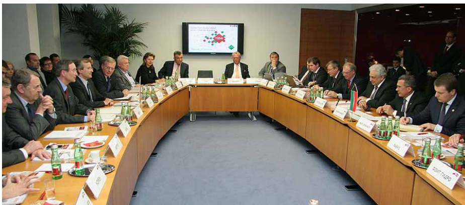
Die Delegationen beider Republiken führten ergebnisreiche Gespräche.