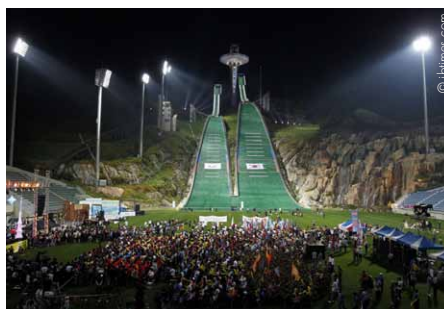
PyeongChang ist bereit für Olympia 2018.

China erlebt seit seiner wirtschaftlichen und politischen Öffnung vor rund drei Jahrzehnten einen rapiden gesellschaftlichen Wandel. Die chinesische Mittelschicht wächst und mit ihr auch das Streben nach Individualität, Selbstverwirklichung und Freiheit. Die Freizeitwirtschaft boomt wie nie zuvor. Erlebnisparks, Golfplätze und Skigebiete bieten daher eine Möglichkeit, Investoren für touristische Projekte zu gewinnen. Was vielerorts noch fehlt, sind Visionen einer ganzjährigen Nutzung bei der Planung, das Know-how bei der Umsetzung komplexer Projekte, sowie die Produkte, die Erfolgsfaktoren bei Projekten sind. Im Rahmen des Branchenfokus Tourismus, Sport und Freizeit sollen unter dem Titel „Skifahren im Reich der Mitte – Österreichs Siegeszug auf chinesischen Pisten“ der Freizeitwirtschaftssektor vorgestellt und die Möglichkeiten aufgezeigt werden, mit