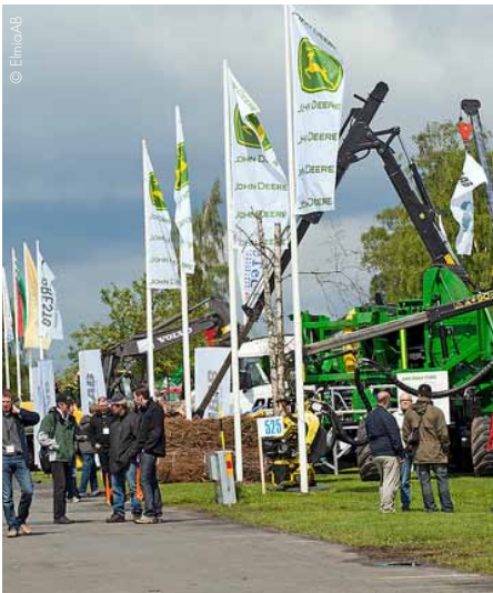
Die World Bioenergy 2011 lockte zahlreiche Besucher sowie Aussteller an.

Schweden ist seit vielen Jahren einer der globalen Vorreiter in Sachen Bioenergie und ökologische Entwicklung. Biomasse ist mit einem Anteil von 32 Prozent mittlerweile Schwedens größte Energiequelle und liefert Energie für alle Lebensbereiche. Aber auch Biodiesel und Biogas sind nicht nur in Skandinavien, sondern weltweit von immer größerer Bedeutung. Nach wie vor birgt die junge Branche großes Wachstumspotenzial und hervorragende Chancen.