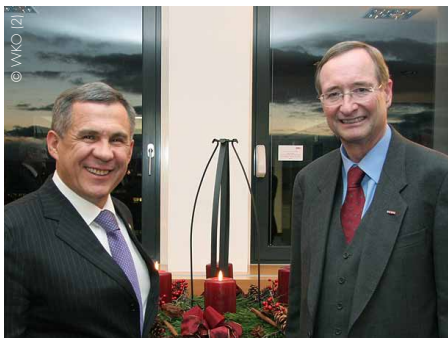
Tatarstans Präsident Rustam Minnikhanov gemeinsam mit WKÖ Präsident Christoph Leitl.

Der Präsident der autonomen russischen Republik kam zu Wirtschaftsgesprächen in die WKÖ.