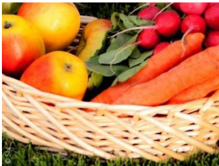
Österreichische Bio-Produkte genießen im Ausland einen guten Ruf.