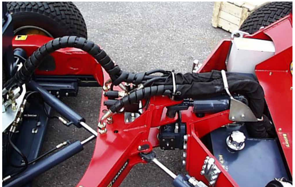
Palfinger Produkte erfreuen sich weltweit enorm großer Beliebtheit.

ihre Geschäftsentwicklung 2011, den Ausblick auf 2012 und die detaillierten Zahlen im Konzernabschluss. Auf der Hülle, in der sie gebündelt sind, ergibt sich stets eine neue Aussage und Bildkomposition, je nachdem, welches der Bücher an vorderster Stelle eingeordnet wird.