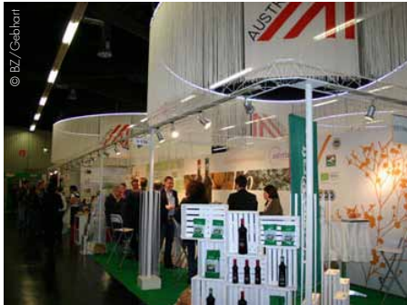
Die BIOFACH 2012 lockte 43.000 internationale Besucher an.

Auf der BIOFACH 2012 in Nürnberg glänzten 88 österreichische Aussteller mit zahlreichen Köstlichkeiten.