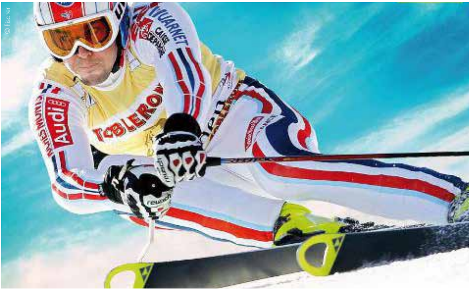
Die Wintersportbranche in den USA wächst von Saison zu Saison.