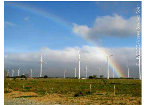
Mexiko möchte bis 2024 beträchtliche Änderungen auf dem Energiesektor vornehmen.

Norwegen ist eines der am reichsten mit Energiequellen ausgestatteten Länder der Welt. Bis zum Jahr 2030 hat sich das Land